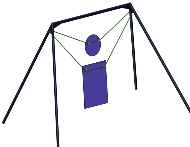
Рис. 2 к приложению № 2 к Правилам вида спорта «стрельба на дальние дистанции».

Рекомендуется, чтобы металлические гонги были соединены со стойками через подвижное звено, например – резиноканевую транспортерную ленту, металлический трос или цепь, таким образом, чтобы гонг свободно висел, возвращаясь к своему первоначальному положению после попадания за счет собственного веса.